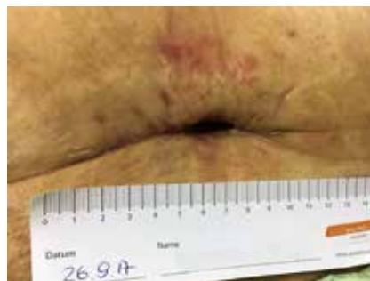
Abb. 5: Wundzustand am 26.09.2017 1,4 x 0,8 x 0,5 cm, Granulationsphase, Wundgrund sauber und granulierend, intakter Wundrand