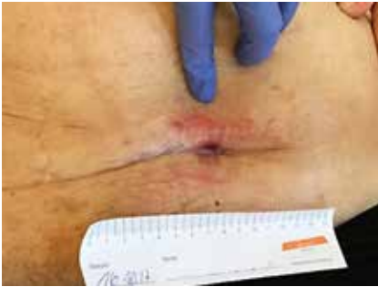
Abb. 7: Wundzustand am 16.10.2017 1,0 x 0,4 x 0,3 cm, Granulationsphase, Wundgrund sauber und granulierend, intakter Wundrand