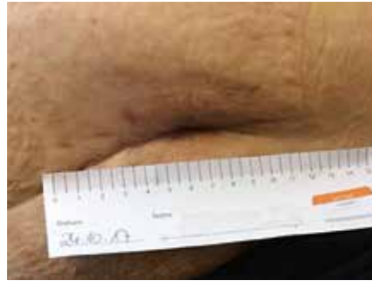
Abb. 8: Wundzustand am 24.10.2017 0,5 x 0,3 x 0,3 cm, Epithelisierungsphase, Wundgrund sauber, Restdefekt granulierend, intakter Wundrand