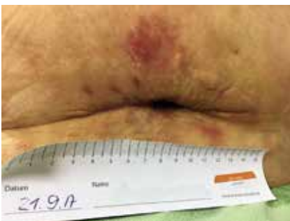
Abb. 4: Wundzustand am 21.09.2017 2,0 x 0,8 x 0,5 cm, Granulationsphase, Wundgrund sauber und granulierend, intakter Wundrand