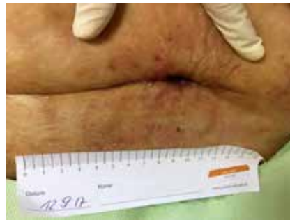
Abb. 2: Wundzustand am 12.09.2017 2,0 x 0,8 x 0,8 cm, Exsudationsphase, Fibrin komplett rückläufig, Wundgrund sauber und granulierend, intakter Wundrand