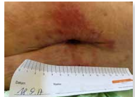
Abb. 3: Wundzustand am 19.09.2017 2,0 x 0,8 x 0,8 cm, Granulationsphase, Wundgrund sauber und granulierend, intakter Wundrand