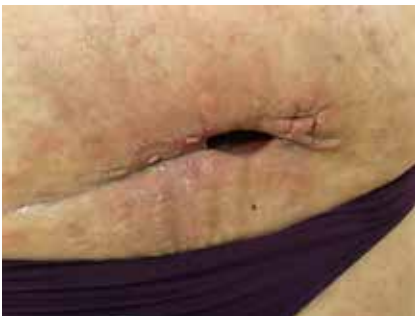
Abb. 1: Wundzustand am 29.08.2017 1,3 x 3,5 x 2,5 cm, Exsudationsphase, mäßige Fibrinbeläge, entzündeter Wundrand

Die Verbandwechsel erfolgten in der Arztpraxis in Abständen mit der Wundexpertin. Schwierige psychische Verfassung der Patientin aufgrund der langwierigen Wundheilungsstörung.